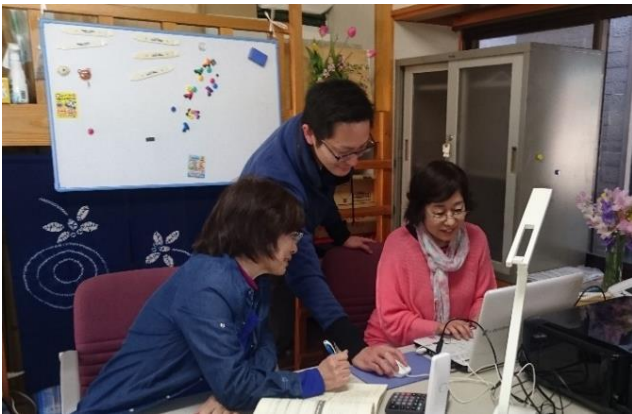
喫茶けやき裏に開設された事務所も整いました。

事務所開き当日、これまで事業認可取得に携わってきた関係者と、ささやかながらお祝いお食事会を開催しました。