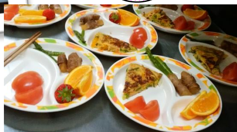
キッシュ・大根肉巻

開催 第1木曜、第3火曜 午後4時30分～午後8時 場所 喫茶けやき 住所 新潟市西区上新栄町3-4-83 参加費 1人200円 (子供はお手伝いで無料) 電話 025-260-7798