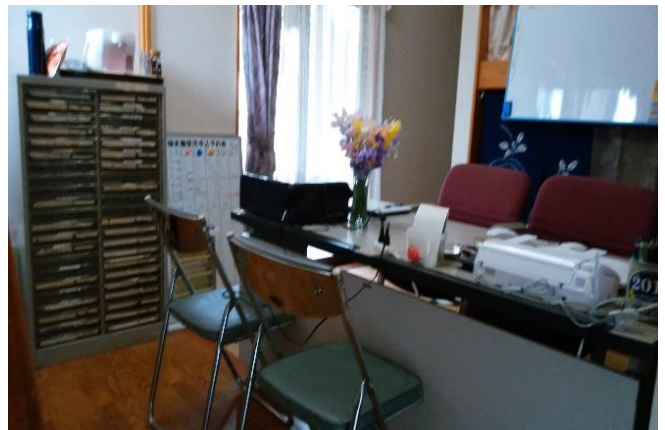
事務所の備品はすべてご寄付いただきました。