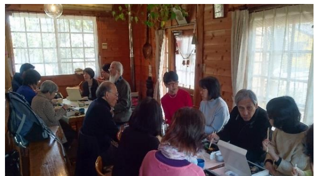
「お弁当食べてもうひとがんばりしようね！！」