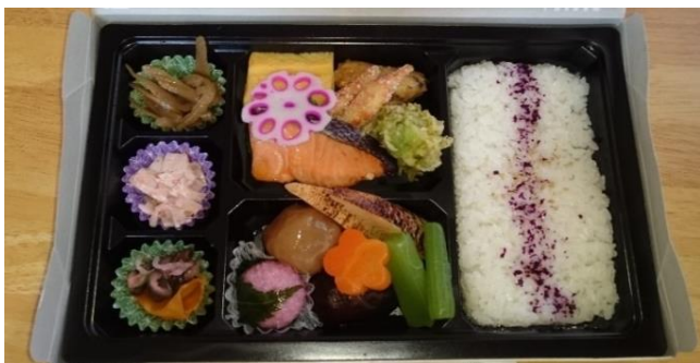
坂井輪図書館近くの「採食や」の美味しいお弁当