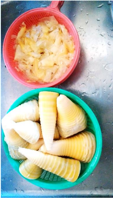
春の恵み（竹の子、ふき） 野菜、ジュース…………… お金など